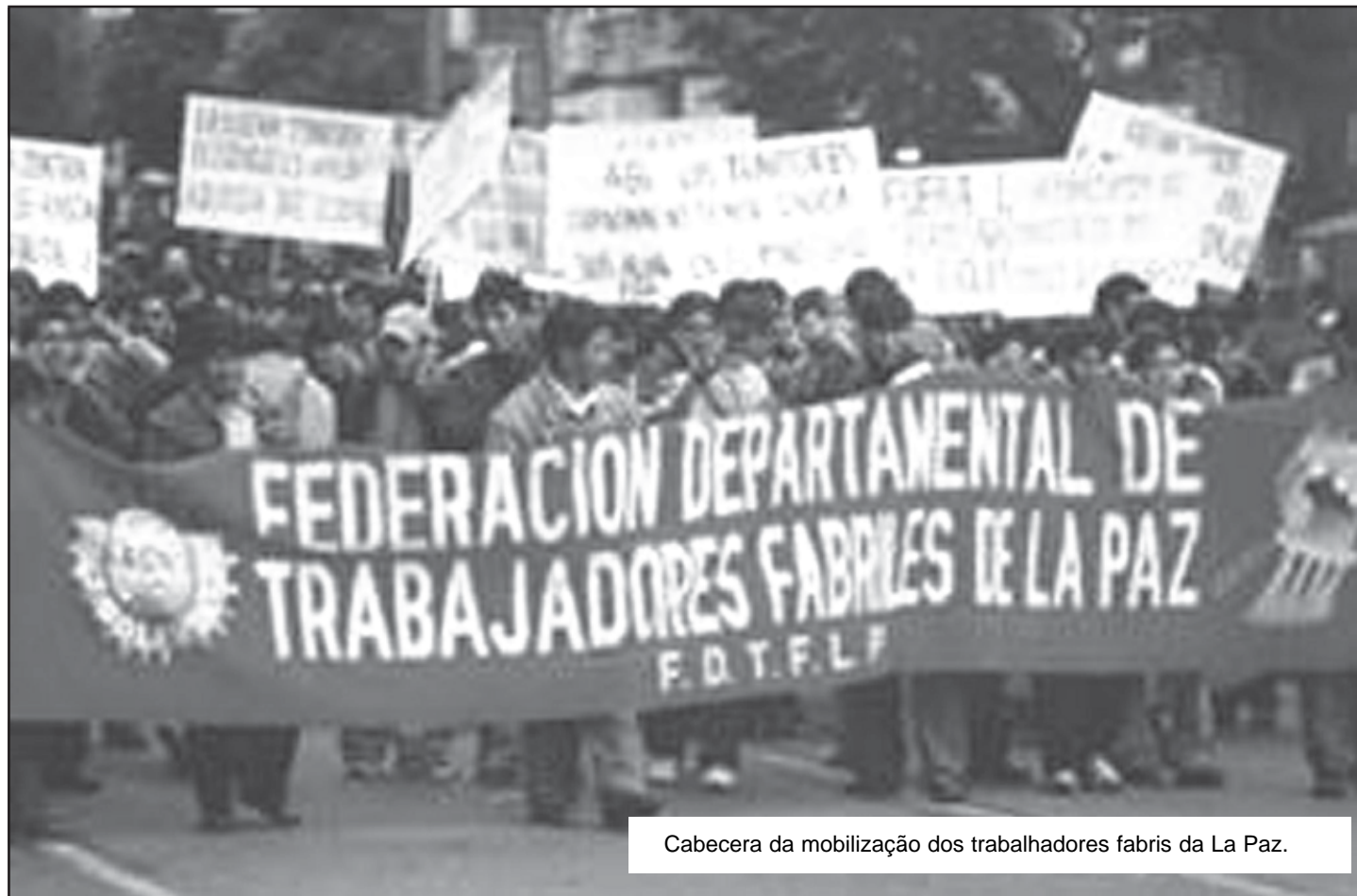
Cabecera da mobilização dos trabalhadores fabris da La Paz.

Ou com os operarios fabris de La Paz enfrentando à burocracia sindical e a demagogia de “esquerda” de Morales e os governos bolivarianos expropriadores da revolução