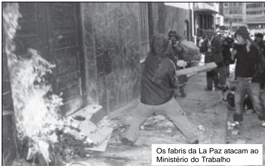
Os fabris da La Paz atacam ao Ministério do Trabalho

Não somos reformistas, ainda que entregamos aos trabalhadores a plataforma mais avançada de reivindicações, somos, s o b r e t u d o , revolucionários, por que nos dirigimos a transformar a estrutura mesma da sociedade.