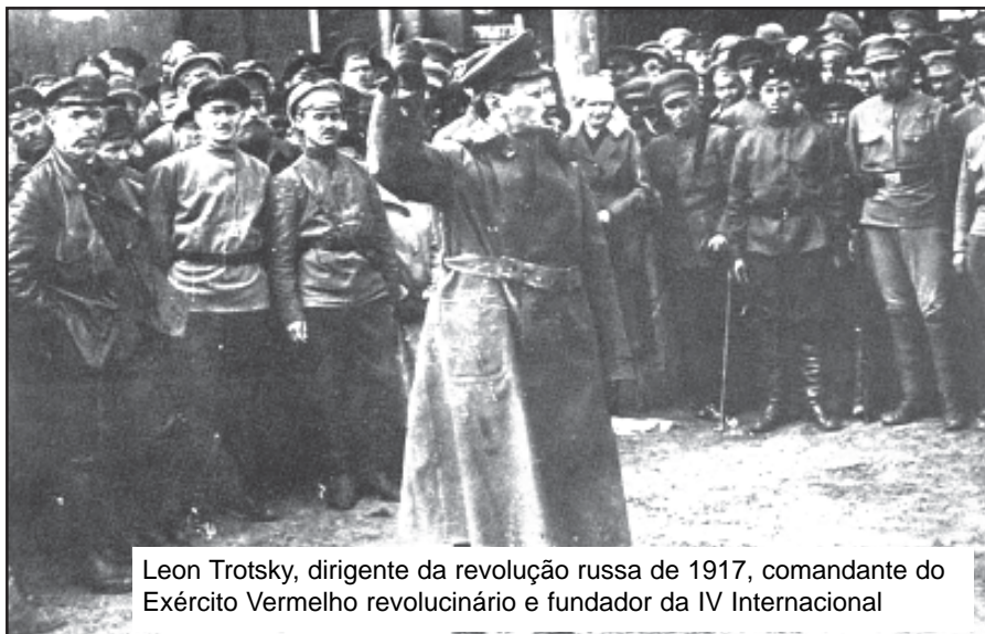
Leon Trotsky, dirigente da revolução russa de 1917, comandante do Exército Vermelho revolucionário e fundador da IV Internacional

destino da propriedade privada. Tal destino será assinalado pelos trabalhadores nas ruas. Conquanto não negamos a luta parlamentar, submetemo-la a determinadas condições. Devemos levar ao parlamento a elementos revolucionários provados, que se identifiquem com nossa conduta sindical. O parlamento deve ser convertido em tribuna revolucionária. Sabemos que nossos representantes serão uma minoria, mas também que se encarregarão de desmascarar, desde o seio mesmo das câmaras, as manobras da burguesia. E, sobretudo, luta-a parlamentar deve estar diretamente unida à ação direta de massas. Deputados operários e trabalhadores mineiros devem atuar sob uma só direção: os princípios da presente Tese Central.