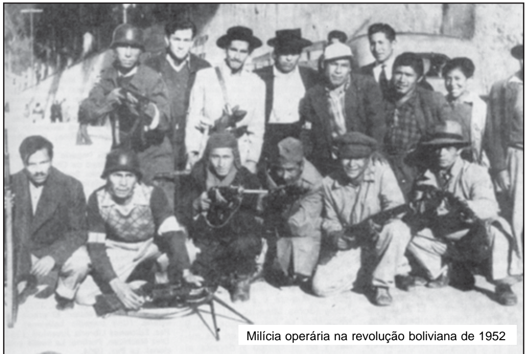
Milícia operária na revolução boliviana de 1952

7.- Os senhores feudais têm amalgamado seus interesses com os do imperialismo internacional, do que se converteram em seus serventes incondicionais. Daí que a classe dominante seja uma verdadeira feudal-burguesia. Dado o primitivismo técnico seria inconcebível a exploração do latifúndio se o imperialismo