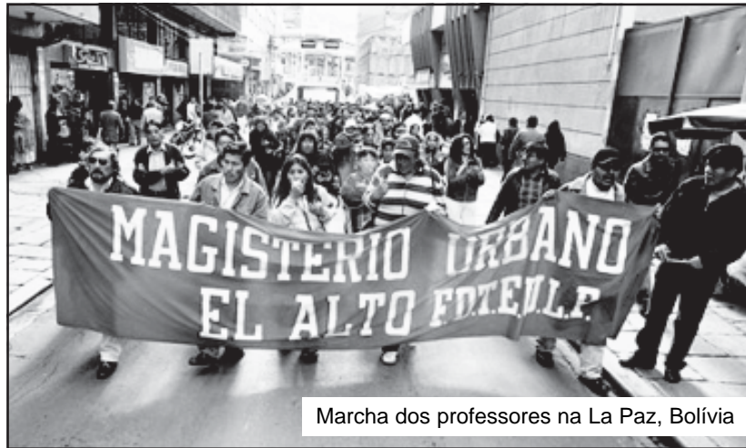
Marcha dos professores na La Paz, Bolívia

A classe obreira canetaviana deve levantar a demanda de ¡ Espingarda, metralla, Palestina não se cala! ¡Pela destrucción do estado sionista fascista de Israel! ¡Pela derrota militar de todas as tropas imperialistas em Afganistán e Iraque! ¡Meio Oriente deve ser a tumba do imperialismo!