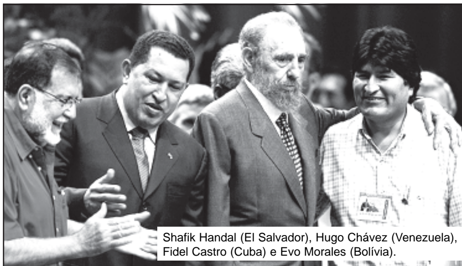
Shafik Handal (El Salvador), Hugo Chávez (Venezuela), Fidel Castro (Cuba) e Evo Morales (Bolívia).

5. A crise mortal do capitalismo imperialista lhe tirou todos seus pontos de apoio ao reformismo, e propõe imperativamente a ruptura com a política reformista, lutando de forma revolucionária, como propõem as Tesis de Pulacayo, pela conquista do poder e a implantação do governo obreiro e camponês como único meio para derrotar ao capitalismo.